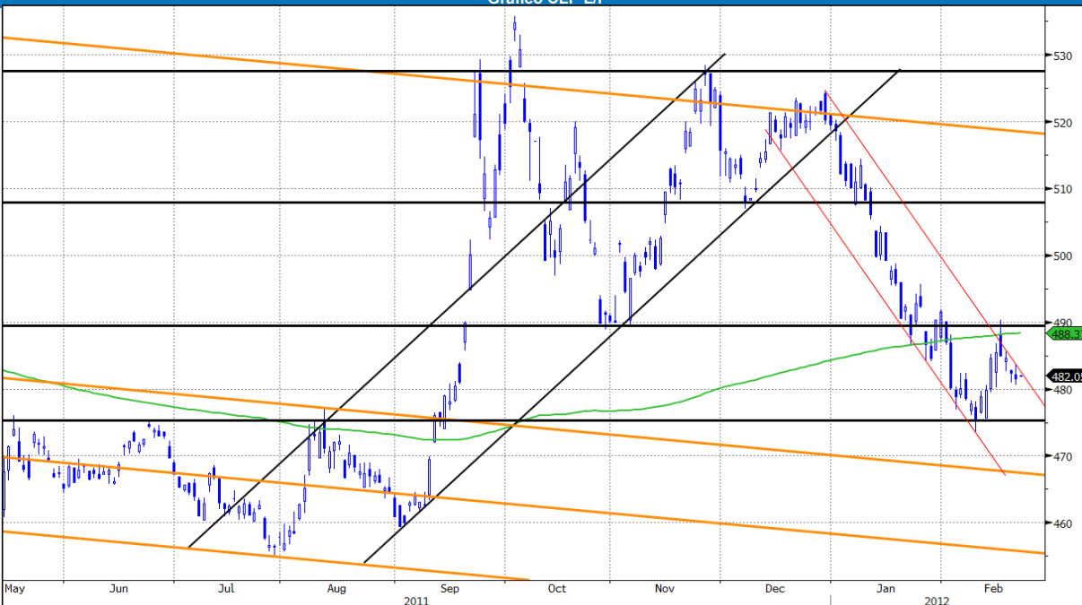
Gráfico CLP L/P

El Cobre está en 3,82 y sigue tratando de mantenerse sobre el 3,80.